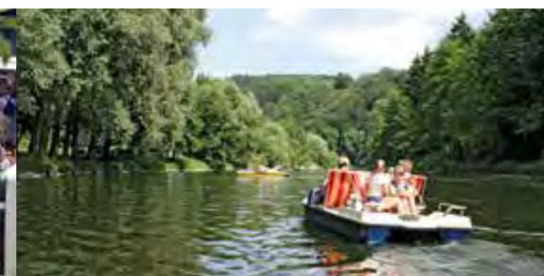
Entspannt: Tretboot fahren bei Herchen