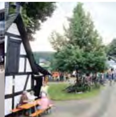
Für die Gourmets: Glockenhäuschen in Wallmenroth