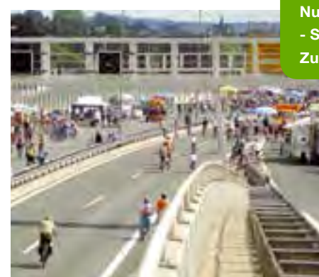
Radfahren auf der HTS, nur bei Siegtal pur