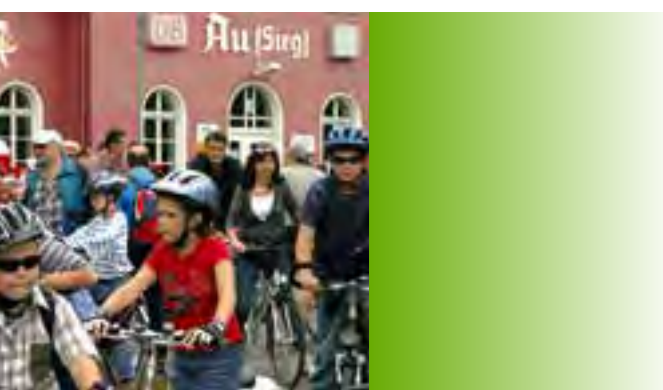
Startklar: Die Tour beginnt