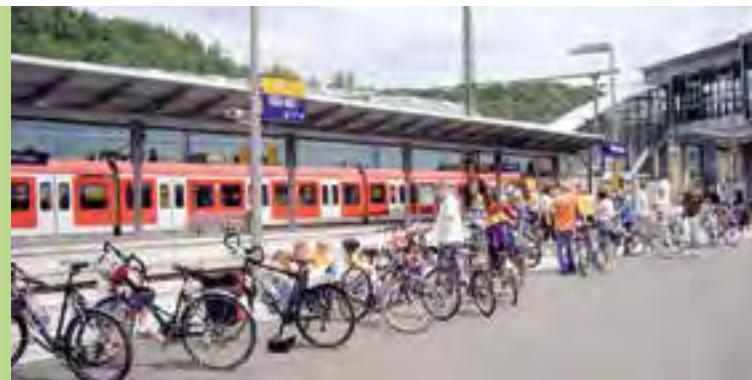
Für die Mobilität: Sonderzüge der Bahn mit großem Fahrradabteil

Fahrrad-Pannendienst: Info-Stand movelo Repräsentanz Rhein-Main-Taunus, Frankenthal, Wissen (beim Gartencafé)