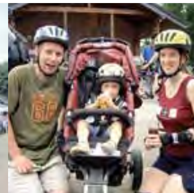
Für die ganze Familie: Kinderfreundliches Siegtal