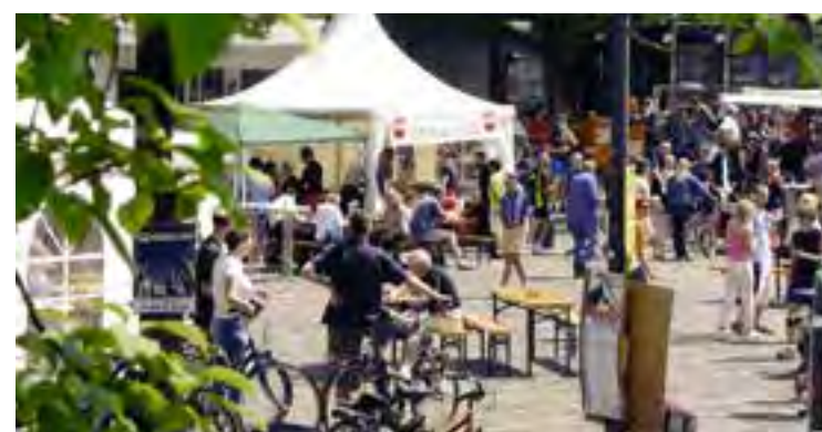
Lebendig: Marktplatz von Eitorf