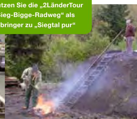
Kohlenmeiler in Netphen-Walpersdorf